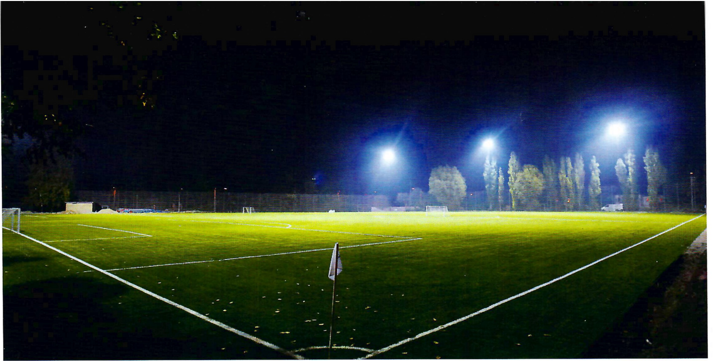
Sådan tog kunststofbanen sig ud, da spillerne var gået ind for at hygge sig med en sodavand – eller noget helt andet. Hvilken forskel fra den gamle jordbane.