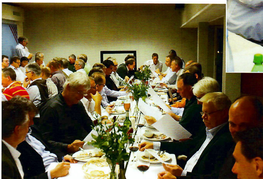
En tipskupon fik panderynkerne frem hos de fleste.